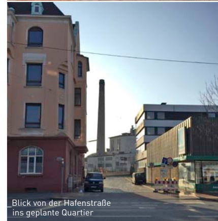
Blick von der Hafenstraße ins geplante Quartier