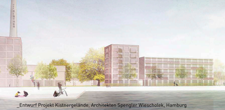
Entwurf Projekt Kistnergelände, Architekten Spengler Wiescholek, Hamburg