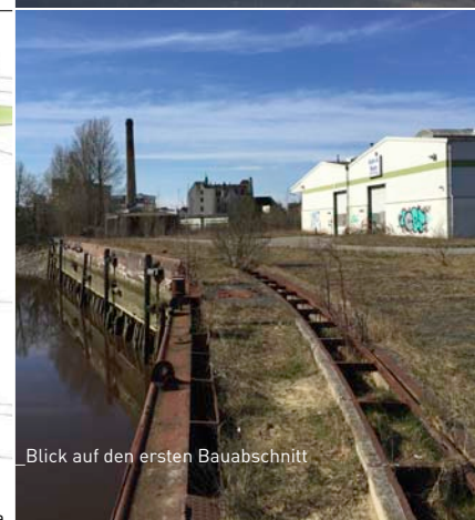
Blick auf den ersten Bauabschnitt