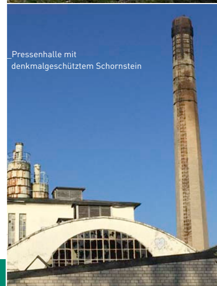
Pressenhalle mit denkmalgeschütztem Schornstein