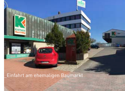
Einfahrt am ehemaligen Baumarkt

Der zweite Bauabschnitt sieht auf dem östlichen Teilstück die Errichtung eines modernen Wohnquartiers am Wasser mit zehn Mehrfamilienhäusern samt Kindertagesstätte vor.